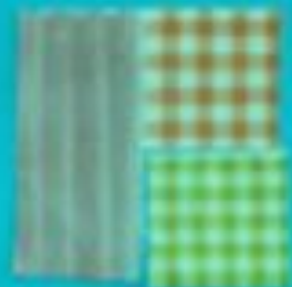
Linges de maison